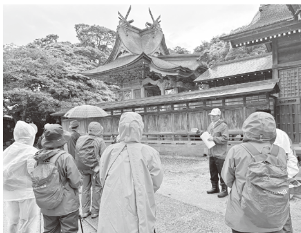
▲ガイドさんの説明を聞く参加者