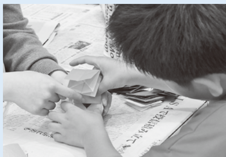
▲難しいけど、頑張っって折りました

地球温暖化に歯止めがかからず、今年の夏も暑くなるという予報もあります。温暖化にもつながる「ごみの排出」の削減、リサイクルの推進、ごみのポイ捨てをなくす取組など、皆さんのご意見をお聞きし、ご協力をいただきながら、地球環境や村の環境を守る取組を進めていきたいと思えます。