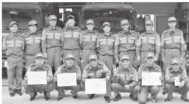
▲優勝おめでとうございます!

優勝した本村消防団は西部地区代表として7月7日(日)に行われる第70回鳥取県消防操法大会へ出場されます。県大会での更なるご健闘を期待しています。