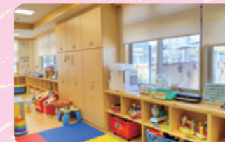
支援センター室内