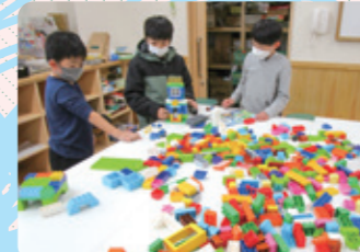
カブラで創作活動

子どもたちの自律を支援します。異年齢の 子どもたちが過ごす良さを生かし、自主性、 社会性、創造性を高める活動を行います。