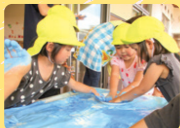
フィンガーペインティング