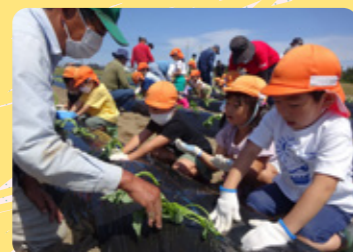
いもうえ・いもほり (地域交流)