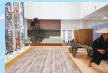
民俗資料館展示・交流室

日吉津村の産業や文化に触れられる展示を 通して、地域を学び、交流することができます。