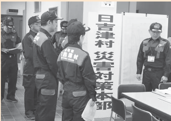
▲防災訓練の様子（2019年）

日吉津村の顔の見える関係性を活かし、関係機関の連携強化による防災力の向上につなげていきたいと思っています。