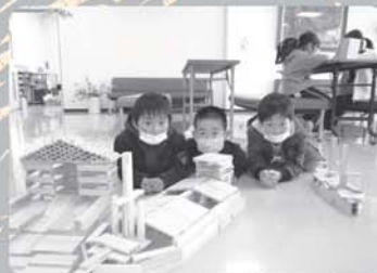
カブラで創作活動

子どもたちの自律を支援します。異年齢の子どもたちが過ごす良さを生かし、自主性、社会性、創造性を高める活動を行います。