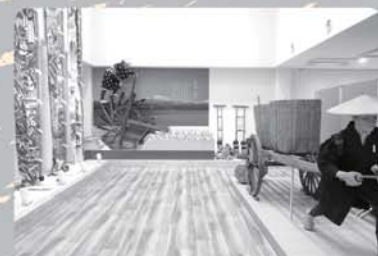
民俗資料館展示・交流室

日吉津村の産業や文化に触れられる展示を通して、地域を学び、交流することができます。