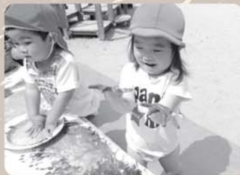
フィンガーペインティング