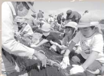
いもうえ・いもほり(地域交流)