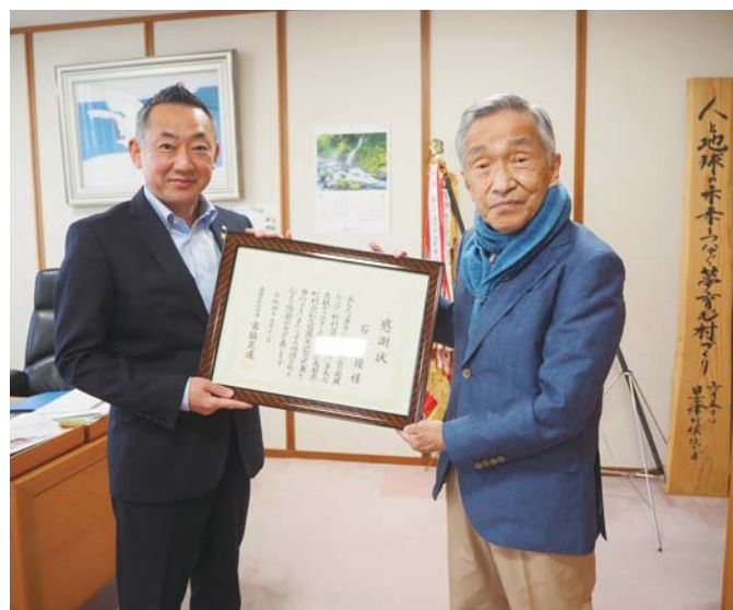
▲左：中田村長 右：石前村長