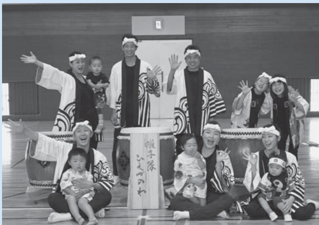
▲囃子隊“ひえづのわ”の皆さん

ヴィンステヒえづでは、村民の皆様による様々なグループ活動が行われています。新たな活動のスタートアップ支援や、活動される皆様が楽しみながらその活動の輪を拡げていただけるよう、ヴィンステヒえづでサポートをしていますので、お気軽にご相談ください。