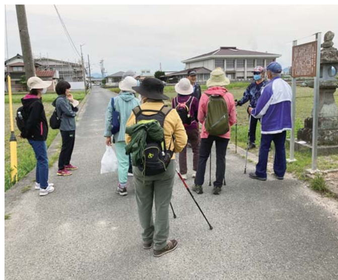
▲金毘羅大権現 常夜燈（富吉）