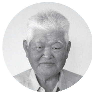
村アグリマイスター(ネギ・さつまいも)