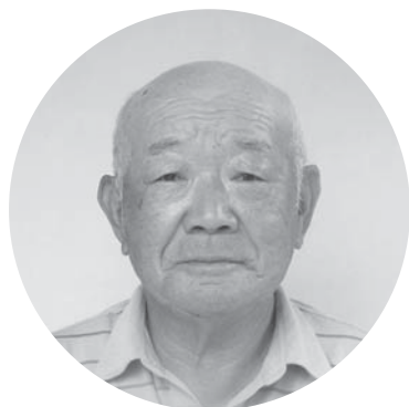
村アグリマイスター(トマト)