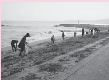
▲クリーン作戦の様子

今後なるべく多くの皆さんに関わっていただきながら、日吉津の美しい自然環境を次世代につないでいきたいものです。