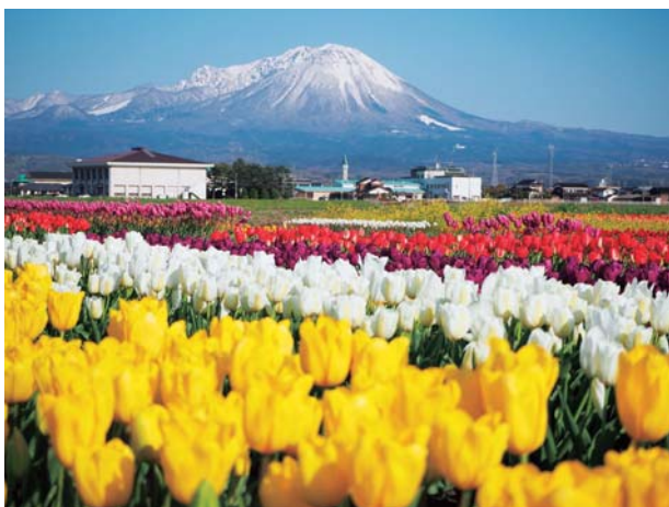
▲大山とチューリップ畑（4月撮影）