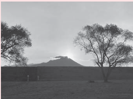
▲ダイヤモンド大山

今年の日吉津村成人式では、45名の皆様が新成人として新たなスタートを迎えられます。大きな変化の時代の中にありますが、これは新たなチャンスが生まれる時代でもあると思います。新成人の皆様のご活躍を期待するとともに、村民の皆様にとって良い一年となるよう心よりお祈り申し上げます。