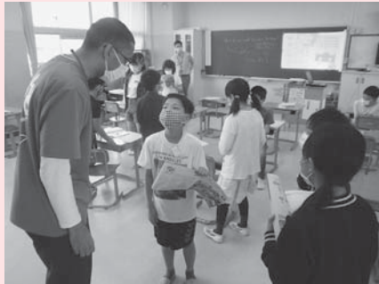
ネイティブなジェイミーの発音にどんどん触れよう!

ジェイミー先生が日吉津小学校に来てから2年半が経ちました。小学校の外国語や保育所の英会話だけでなく、日吉津村の交流英会話、様々なイベントでのゲスト等で活躍しているジェイミー先生に日吉津村での生活について聞いてみました。